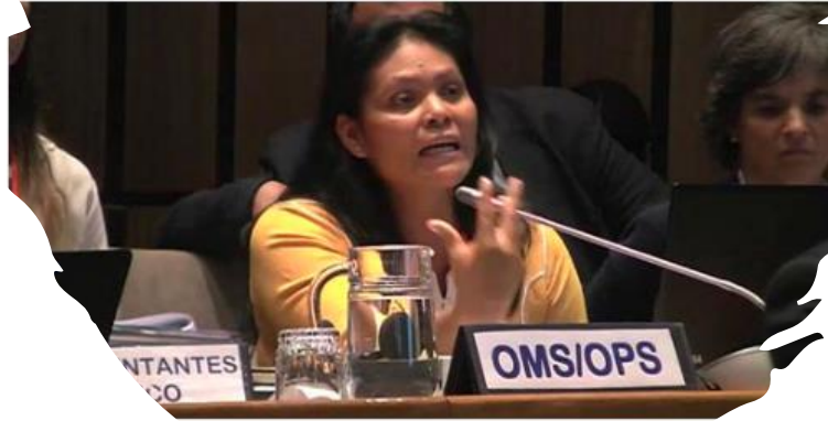
... contribute to Principle 10 ... Indigenous People in the Regional ... Declaration and